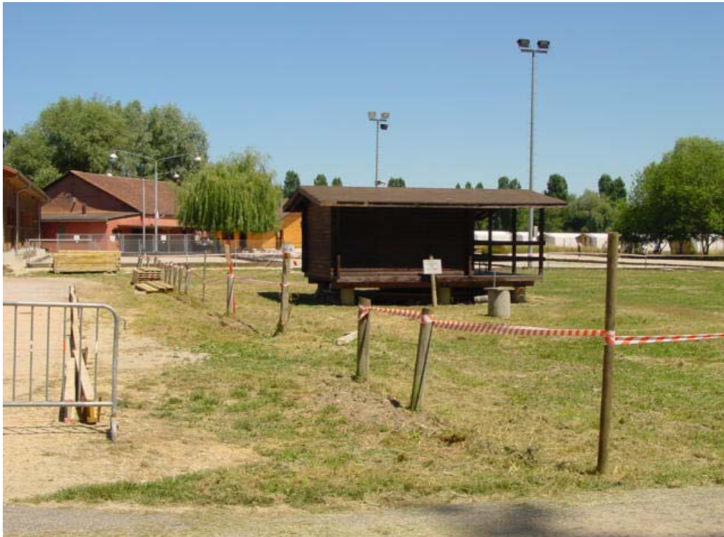
Cabane de l'Archers-Club d'Yverdon-les-Bains:

Terrain du tir à l'arc: avant la plantation de la haie de charmille